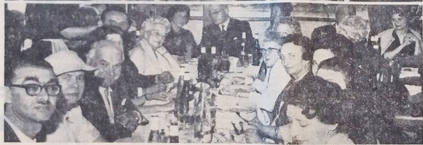
Nombreux furent parmi ces convives ceux qui, après le déjeuner empruntèrent le petit train de la Tour de Mare et devaient être, hélas ! les victimes du tragique accident. Sur notre photo du haut, président le banquet : le prince Xavier de Bourbon-Parme.

Après avoir visité la nouvelle chapelle de Notre-Dame de Jérusalem, à quelques kilomètres de Fréjus, dont la décoration fut commencée par Jean Cocteau, assisté à la bravade, organisée tous les ans le troisième dimanche après Pâques pour honorer saint François de Paule qui, selon la tradition, délivra Fréjus de la peste, les 120 participants se rendirent au domaine de la Tour-de-Mare pour assister au déjeuner qui devait être présidé par le prince Xavier de Bourbon-Parme.