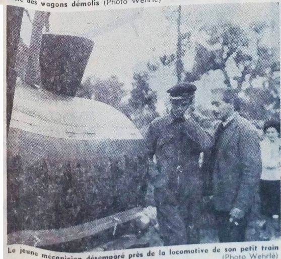
Le jeune mécanicien désespéré près de la locomotive de son petit train