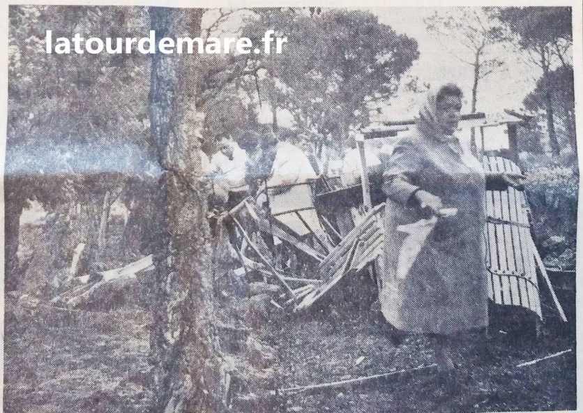
Ce qui reste des wagons démolis

Une quarantaine de membres de la société prirent tout joyeux